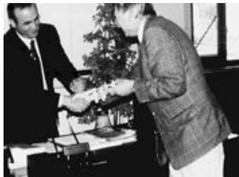
Eine Brücke für den Bürgermeister von Batman

Diese Fahrt und die folgenden Kontakte erwiesen sich als sehr fruchtbar, besonders im Blick auf Mersin. In den Antwortschreiben der Bürgermeister von Batman und Mersin werden die Kontakte nach Kiel sehr begrüßt, die Bereitschaft wird erklärt, alle Unterstützung zu geben, diese Beziehungen zu entwickeln und zu befestigen - mit der Perspektive einer dauerhaften Freundschaft. Es bestehen bereits Vorschläge, wie diese Beziehungen konkret gestaltet