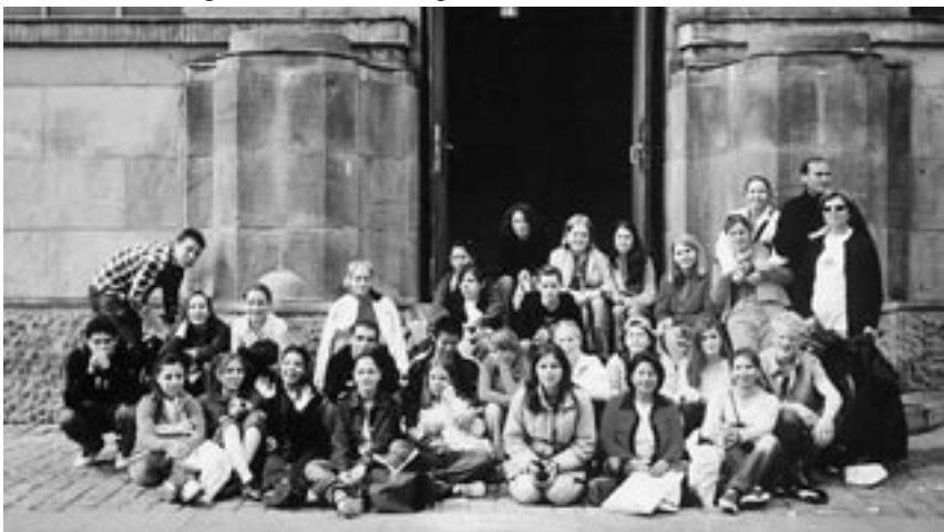
Die Gruppe einer Schule aus Mersin vor dem Kieler Rathaus

sin und Kiel lebendig zu gestalten. Am 18.10.2001 fasste die Kieler Ratsversammlung folgenden Beschluss: „Die Landeshauptstadt Kiel begrüßt die Initiative des Kieler Arbeitskreises „Brückenbauen zwischen Kiel und Städten in der Türkei“ und wird diese im Rahmen ihrer Möglichkeiten unterstützen.“ Durch die Türkei-Reise wurden auch Beziehungen nach Antakya (das alte Antiochien, ein zentraler Ort des Urchristentums) geknüpft. Dort befinden sich fünf Kirchen. Im „Friedenshaus“ treffen sich regelmäßig Christen, Sunniten und Aleviten zum interreligiösen Gebet, es gleicht sehr dem Gebet, wie wir es hier in Kiel praktizieren; wir vereinbarten einen Austausch.