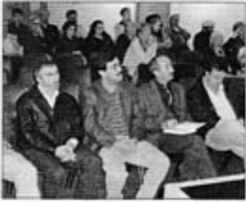
Toplantıya çok sayıda vatandaşımız katıldı.