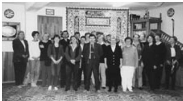
Besuche in einer Moschee

Zunächst hat man versucht, an bestimmten Festtagen in gemieteten Räumen zusammenzukommen (z. B. durch das Mieten einer Sporthalle). Später haben die Muslime Vereine und Moscheen gegründet und finanziert, um ihre Religion, Tradition und Kultur langfristig zu bewahren und weitergeben zu können. Diese große Lücke wurde durch diese Organisationen gedeckt. Die Moscheen entstanden vor allem in der Nähe der großen Industriebetriebe, in denen die türkischen Migranten arbeiteten (Kieler Ostufer und Kiel-Friedrichsort). Diese Moscheen und Vereine versuchen nun durch Dialog, durch die Zusammenarbeit mit anderen Institutionen und durch soziale sowie kulturelle Aktivitäten die Integration in Kiel zu fördern. Oft wurde nur einer aus der Familie Mitglied im Verein, so ist bei den Zahlenangaben jeweils von einer höheren Zahl der Beteiligten auszugehen. Auch werden die Moscheen von vielen besucht, die nicht zu diesen Familien gehören. Gegenwärtig existieren über zehn Moscheen und Vereine. Seit 1995 haben sich türkische Moschee- und Kulturvereine zu dem „Bündnis türkischer Vereine“ zusammengeschlossen. Obwohl unterschiedliche Sichtweisen existieren, ist die Zusammenarbeit zwischen den muslimischen Vereinen sehr fortgeschritten.