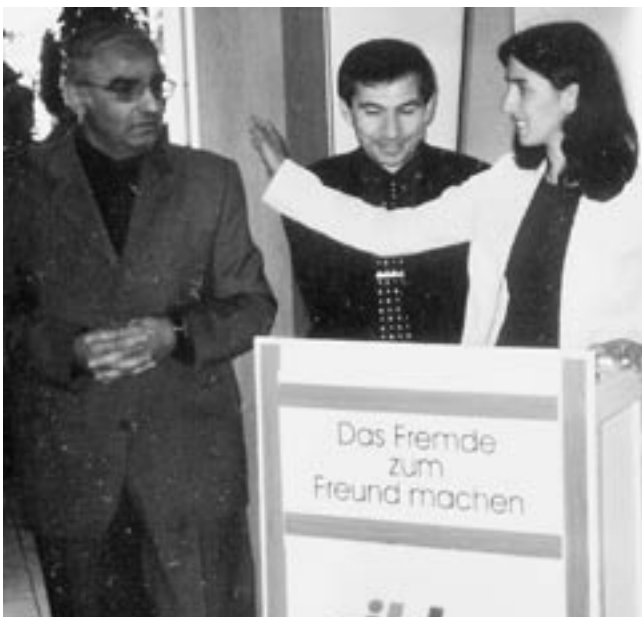
Eröffnung des IBK