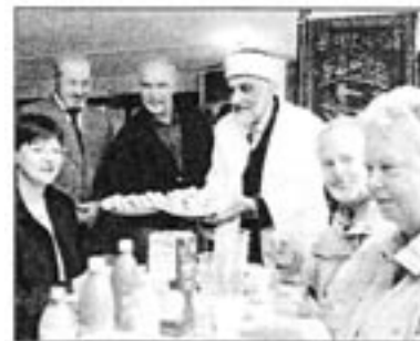
Bei Gebäck und Saft informierten sich gestern viele Kieler in den Moscheen über den Islam.

Der Boden der Moschee ist mit Matten oder Teppichen ausgelegt. Vor dem Eintreten zieht man sich die Schuhe aus, damit kein Schmutz von draußen die Moschee verunreinigt. Fächer oder Ablagen zur Aufbewahrung der Schuhe stehen bereit. Für die rituellen Waschungen vor dem Pflichtgebet findet man in den meisten Moscheen auch Waschgelegenheiten vor.