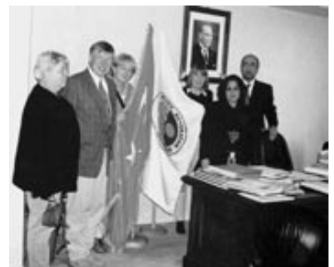
Empfang beim Bürgermeister von Mersin