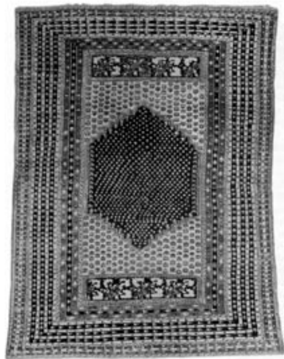
Gebetsteppich aus dem 18. Jh.