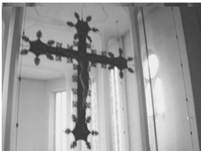
Dieses Kreuz von 1490 in der Nikolai-kirche weist als Lebensbaum auf die Auferstehung und auf neues Leben hin.

Die Machthaber seiner Zeit wollen Jesus als Unruhestifter aus der Welt bringen. Jesus hält stand, er geht in die dunklen Seiten unserer Existenz hinein, erleidet alle Ängste und Schmerzen, um uns auch dort nahe zu sein. Er wird gekreuzigt. Christen glauben, dass Gott ihn von den Toten auferweckt hat. Indem sie von ihm erzählen und ihn verkündigen, ist er heute unter uns lebendig. Sie bekennen ihn als den in der Bibel verheißenen Messias (wörtlich „Gesalbter“; auf Griechisch „Christus“). Er befreit und ermutigt uns, dass wir aufstehen, den Mächten der Zerstörung und des Todes widerstehen und für einen Frieden eintreten, der auch Benachteiligten Gerechtigkeit gibt.