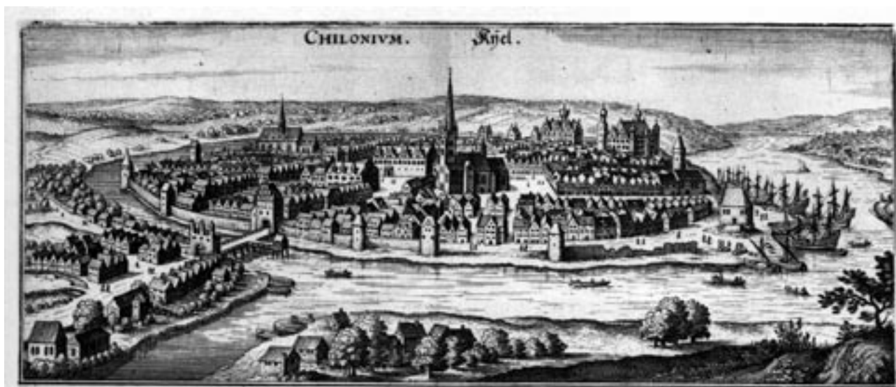
Kiel vom Süden, 1641 (Matthias Merian d. Ä.)

Nachdem Kiel zu Preußen gekommen (1867) und zum Reichskriegshafen geworden war (1871), stieg die Einwohnerzahl rasant - von 18 800 im Jahre 1864 bis auf 175 100 im Jahr 1905. Kiel wurde Stadt der Werften und der Marine mit Garnisonskirchen (zunächst Pauluskirche, dann St. Heinrichkirche und Petruskirche in der Wik). Zu den Gemeinden in Kiel und Umgebung, die aus dem Mittelalter stammten (St. Nikolai, Flemhude, Westensee, Elmshagen, Schönkirchen, Westensee), kamen um das Jahr 1900 neue evangelische Gemeinden (Holtenau, Kiel-Wik, Ansgar, Heiligen-Geist, Luther, Jacobi, Vicelin, St. Jürgen, Michaelis, Gaarden und Bugenhagen in Ellerbek und Wellingdorf). Durch den Aufbau von Marine und Verwaltung sowie durch